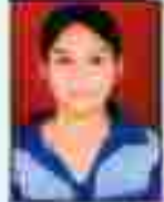
શ્રી મહાશય પટેલ સહકારી