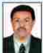
શ્રી મહાશય પટેલ ડિરેક્ટરી