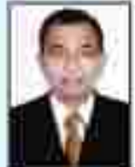
શ્રી મહાશય પટેલ સા.કે. ડિરેક્ટરી