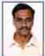
શ્રી મહાશય પટેલ સહકારી