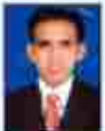
શ્રી મહાશય પટેલ સહકારી