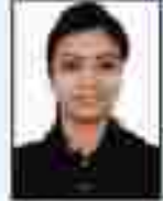
શ્રી મહાશય પટેલ સહકારી