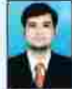
શ્રી મહાશય પટેલ સહકારી