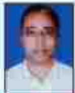
શ્રી મહાશય પટેલ સહકારી