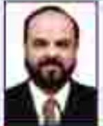
શ્રી મહાશય પટેલ ડિરેક્ટરી