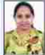
શ્રી મહાશય પટેલ સહકારી