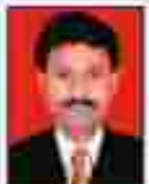
શ્રી મહાશય પટેલ સહકારી